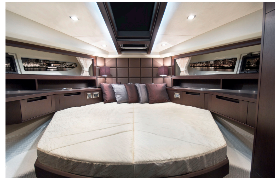
La cabine propriétaire est vaste et dispose de nombreux rangements