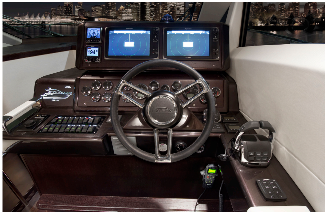
Un poste de pilotage de haut niveau