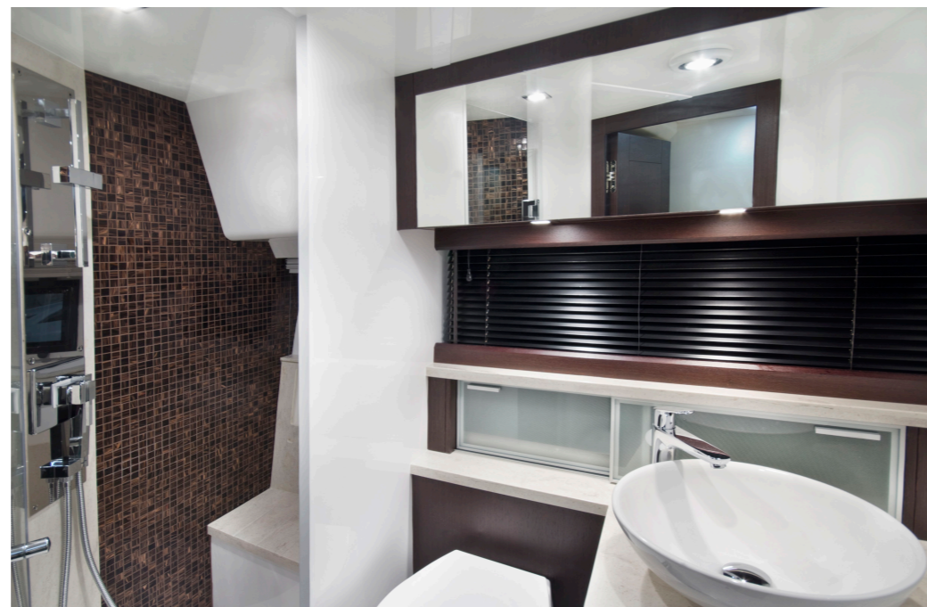
Une des deux salles de bain